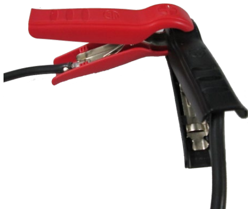
Gambar 3: Penjepit pada aliran pendek

Jika kompensasi kabel diulangi, pengukuran dapat dilaksanakan kembali dengan menekan tombol START.